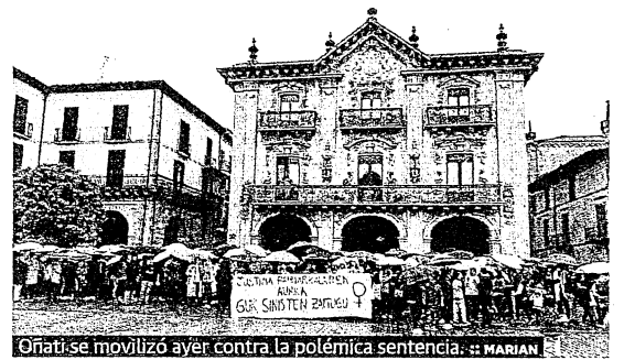
Oñati se movilizó ayer contra la polémica sentencia. de MARIAN

La indignación ante la sentencia de 'La Manada', cuyos cinco miembros han sido condenados a 9 años de cárcel por un delito de abuso sexual continuado y no de violación en los Sanfermines de 2016, se hizo latente ayer también en Oñati a través de una multitudinaria concentración «contra la justicia patriarcal». Jóvenes y adultos mostraron su rechazo a la decisión judicial y su solidaridad y apoyo a la víctima.