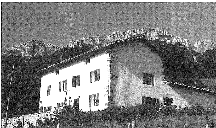
Arrieta Haundi baserrixa Aizkorri azpitan.

Bai, Oñati eta inguruarekin oso pozik geraketan dira, baiña Arantzazuri buruzko iritzixak ez dira berdifiak izaten: batzuk txokauta geldiketan dira hain gauza