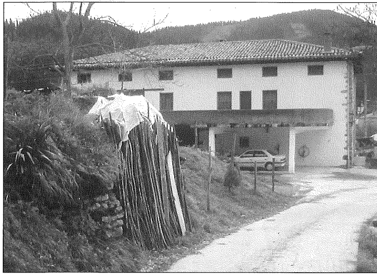
Dolaetxe baserrixa eta karobixa.

jateko. Otia batzeko zizardia ebalten zan, pintxo asko dakolako. Otia falta zanian, egurra sobra egoten zan kamaran, baiña betek otien billa faten ziran berotasun haundixagua emuten ebeilla-