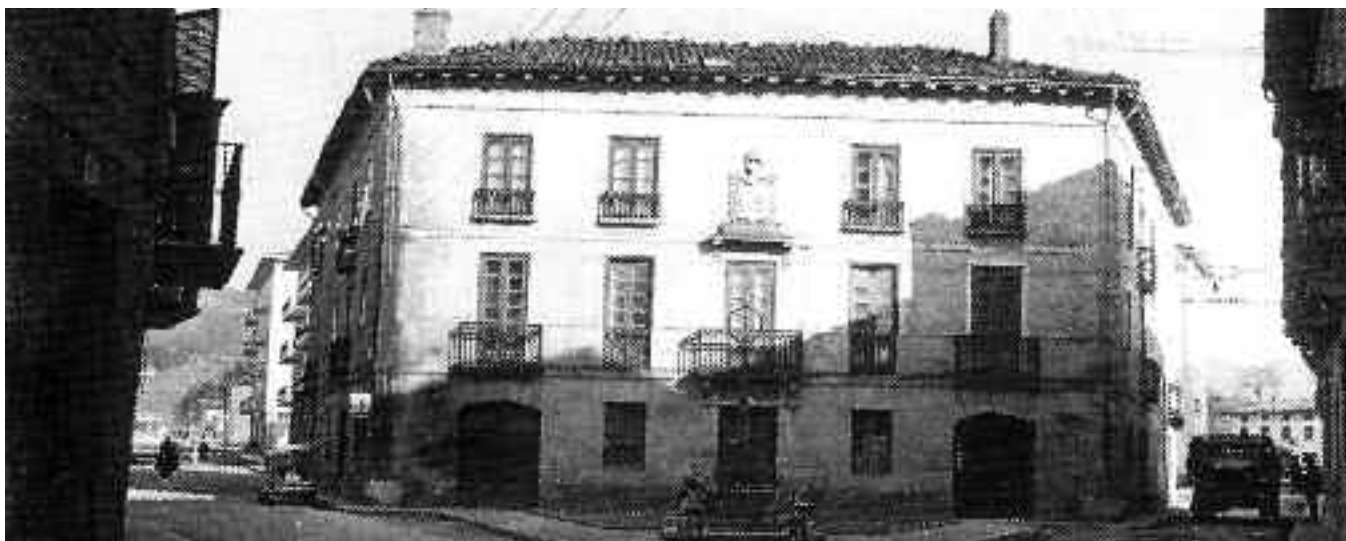
Etxaluze zaharra bota baino urte batzuk lehenago.

Kale Barriaren eta alboko kaleetan etxe-ordezkapen asko egon da, lartxo agian. Dena dela, orain arte aipatutakoez gain, geratzen dira beste banaka batzuk, kanpotik behintzat, osagai interesgarriak mantendu eta gorde dituztenak: adibidez, Santosena , Atxarena , Gereta , Kirriñena , Orbea , Ibarrondo , Ritarena , Egañena , Juanitosa , Konfitteruena , Urrutxuneko atetzarra , Iturritxo , Honbrena , Agerrena , eta abar. Hurrengoan saiatuko gara horietako batzuetan oraindik begi bistan ditugun armarriak, irudiak, atekak, leihoak, miradoreak, behebarruak, modilloiak eta beste elementu ezohiko batzuk ikusarazten.