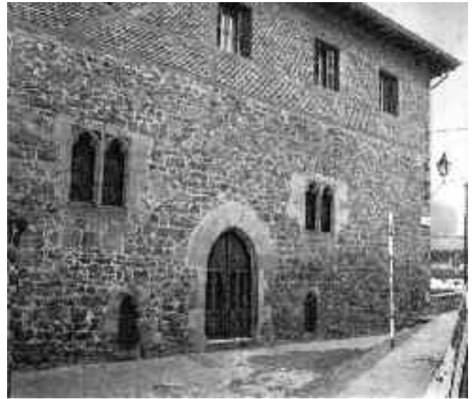
Urain dorretxeko ate eta leiho gotiko batzuk.