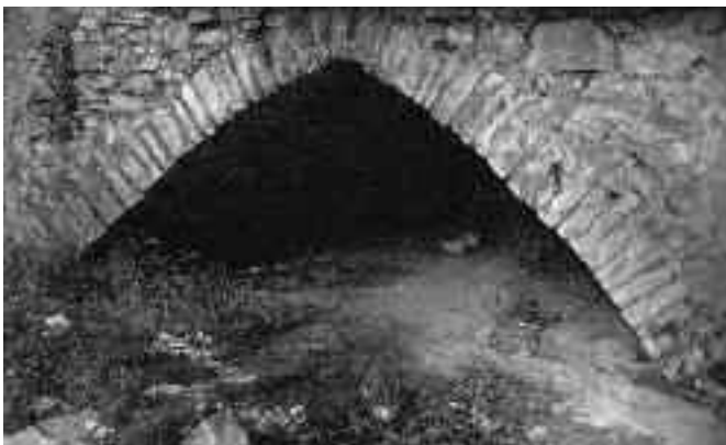
Zubiaurre , Iturritxo ondoan estalita geratu den zubia.