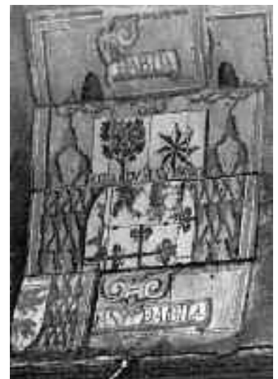
Otadui etxeko armaria zuzendu aurretik zegoen bezala.