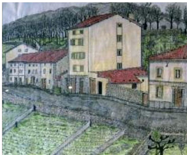
Auzotxo 1960ko hamarkadaren hasieran.