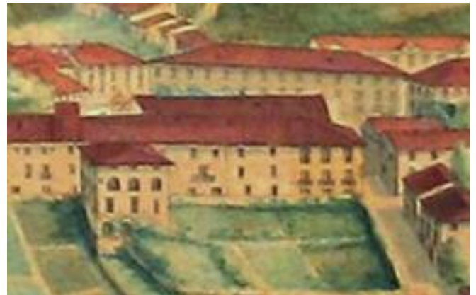
Azkarraga etxearen atzekaldea ezkerrean, eta Don Pedruena eskumara, 1877ko margolan batean

Kontzejuaren ostean eta Kale Barria eta Atzeko kalearen artean aurkitzen da. XVII-XVIII. mendeetan berreraikitako etxetzar honek hiru fatxada dotore ditu kale bietara eta kantoi aldera; burdinazko balkoi zabal ugari lehenengo pisuan, bi oso luzeak ertzetan eta beste sei laburragoak. Sarreran harlanduzko atetzarraren gainean Elorriaga familiaren armarri barrokoa agiri da. Errekarriz osatutako behebarrua , ataria, eta eskailera-burua ere azpimarragarriak dira; baita lehenengo pisuko hainbat gela eta altzari ere.