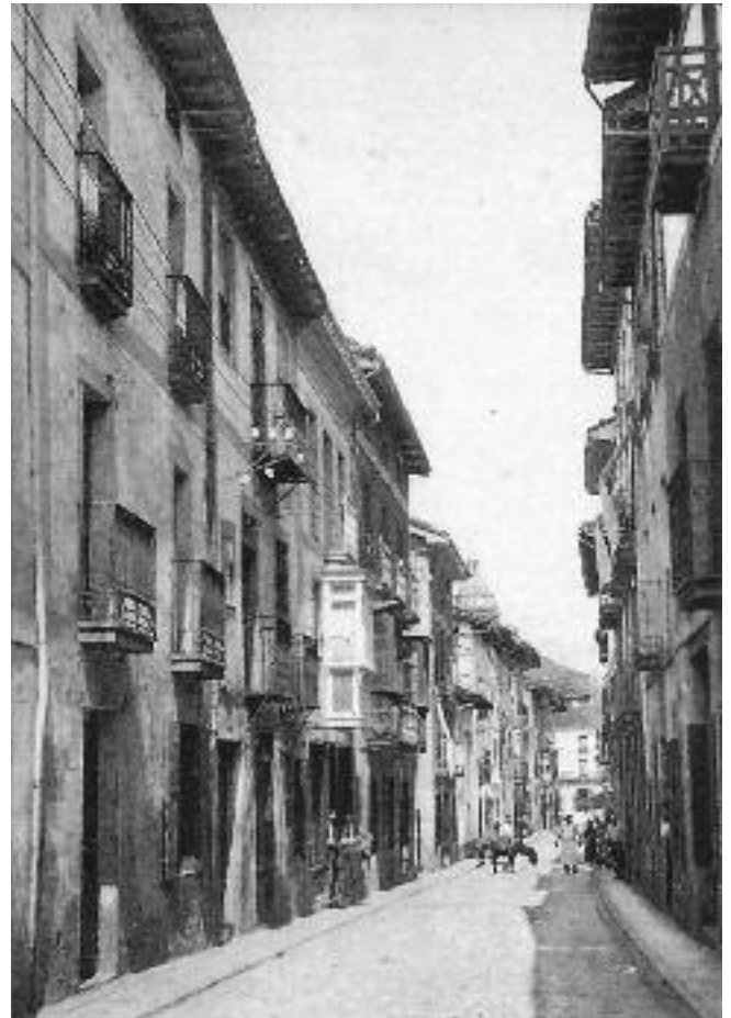
Juanitoseneko denda eta inguruak XX. mendearen 2. hamarkadan.