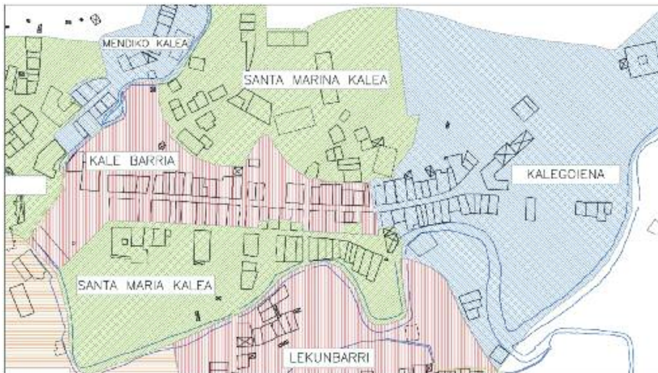
Kale Barria eta inguruak 1848an.