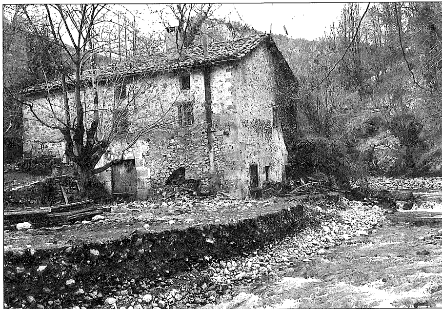
Etxia zutik dago oranddio, baiña errotapeko turtikiñuak eta harrixak orain dala 40 urteko uraundittan hondatu ziran.

Bai, perrau biharra sarrittan eukitten ebein, eta neuk egitten neben hori be.