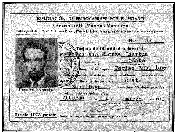
Patxiik betik euki izan dau gauzak gordeteko ohitturia. Hona hemen muestra bat.

Bai, Erromara 1975ian, Compostelara 1971n, Logroñora