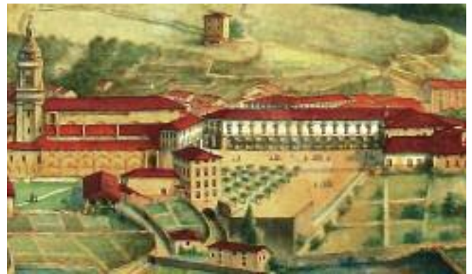
E. Pichot-en margolana, 1877.

Plaza zahar horretan egiten ziren, besteak beste, herritarren batzarreak Oñatiri zegozkion gai garrantzitsuei buruzko era-bakiak hartzeko, artean ez baitzegoen udaletxerik; eta merka-tuak ere zabalgunetxo horretan eratzen zituzten, batez ere Zarateko etxearen aurrealdean aurkitzen zen alderdian: ingu-ru horri Berduraren plazatxoa deitzen zitzaion berandura arte. Errekaren ondoan baziren eraikin batzuk, 1845eko plano horre-tan ageri denez, baina era irregularrean kokatuak. Jesuiten egoi-tza eta eliza izandakoak ere zutik zirauten plazaren eskumako barrenean.