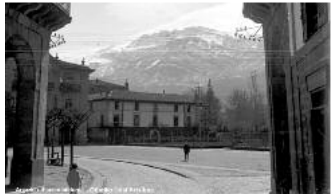
Foruen Enparantza XX. mendean hasieran. Eskuman Merkiena dendaren ate bat.