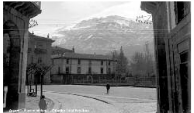
Foruen Enparantza XX. mendean hasieran. Eskuman Merkienea dendaren ate bat.