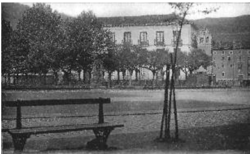
Foruen enparantza iturriarekin kioskoa jarri aurretik (1920ko hamarraldia)

Neskatilen eskola horri erantsita 1960ko hamarkadan mutikoen herri-eskola jaso zen, maristak 1963an herritik joan zirenean. Eskola hori merkatuaren porlanezko estalkiaren gainean altxatu zuten; herri-eskola moduan jardun zuen 1979-1980 ikasturtera arte, eta hurrengo kurtsoan izena estreinatu berria zuen Txantxiku ikastola plazako ikasgela horietara aldatu zen; han jarraitzen du, geroago birmoldatu zen Santa Anako ikastetxearekin batera.