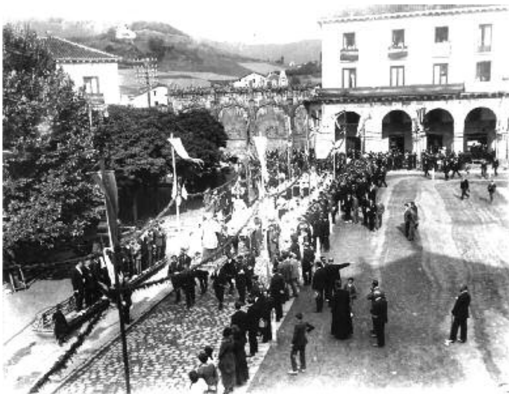
Prozesioa plazan gora Eusko Ikaskuntzaren I. Biltzarrean (1918).