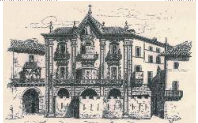
Oñatiko udaletxea gotortuta azkenengo karlistadian (1873).