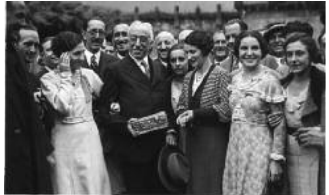
N. Alcalá Zamora presidentea Oñatiko plazan (1933).

- Trantsizioaren ondorengo azken hamarkadetan ere maki-na bat agintari, lehendakari eta politikoa hurreratu zaigu, baina hori azaltzeak beste atal oso bat eskatuko luke. Badago, bai, hori ere aztertze gaia.