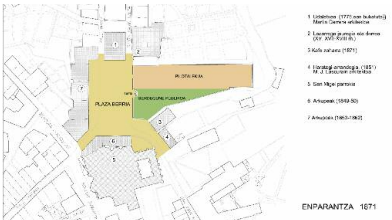
Plaza nagusiaren egitura berria 1871an.