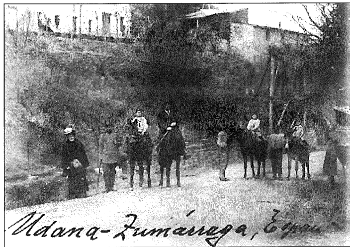
Udanara - Zumárraga, Euzkadi Ordainketa egunian Kataberara fateko gertu, eskolta eta guzti.

ko. Goiko kabliak senduak ziran, behekuak, berriz, koska batzuk eukain. Balde asko ziran, batetik bestera metro batzutako tartia jareta. Behera beteta zixoianaren kontrapixuak behetik hutsik etorrena jasoten eben.