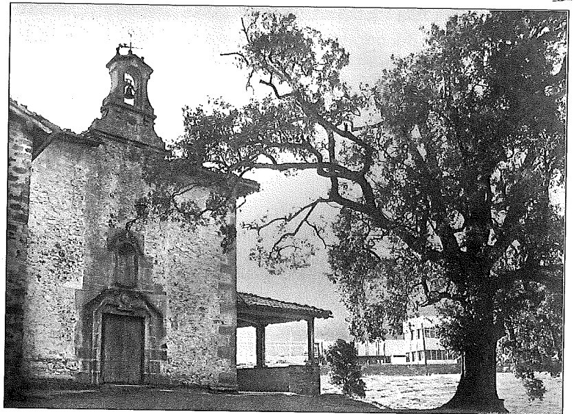
Madalenako ermita aurrekaldian San Frantziskok sartutako artia, tradiziñuak dixuenez; gaur egun igartuta ei dago. (Argazkixa: Pedro Luis, 1982).

Ez, errekiak beste aldera gerketan dan Garibai auzokuak be honako jokeria dakoi, zapatu dantetan mezetara etorten dira, juntan badagoz batzuk eta auzuan pagau be egingo daue. Urtian behin egitten da juntia, San Juanetik hurrengo domekan eta San Pedrotik