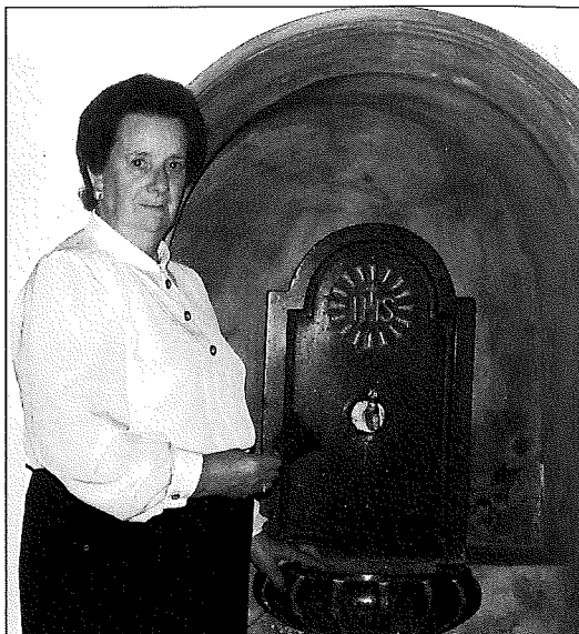
San Frantziskoren kanpanillatik edateko ur bedeinkatua sankristixa onduan daguen iturri honetan egoten zan.