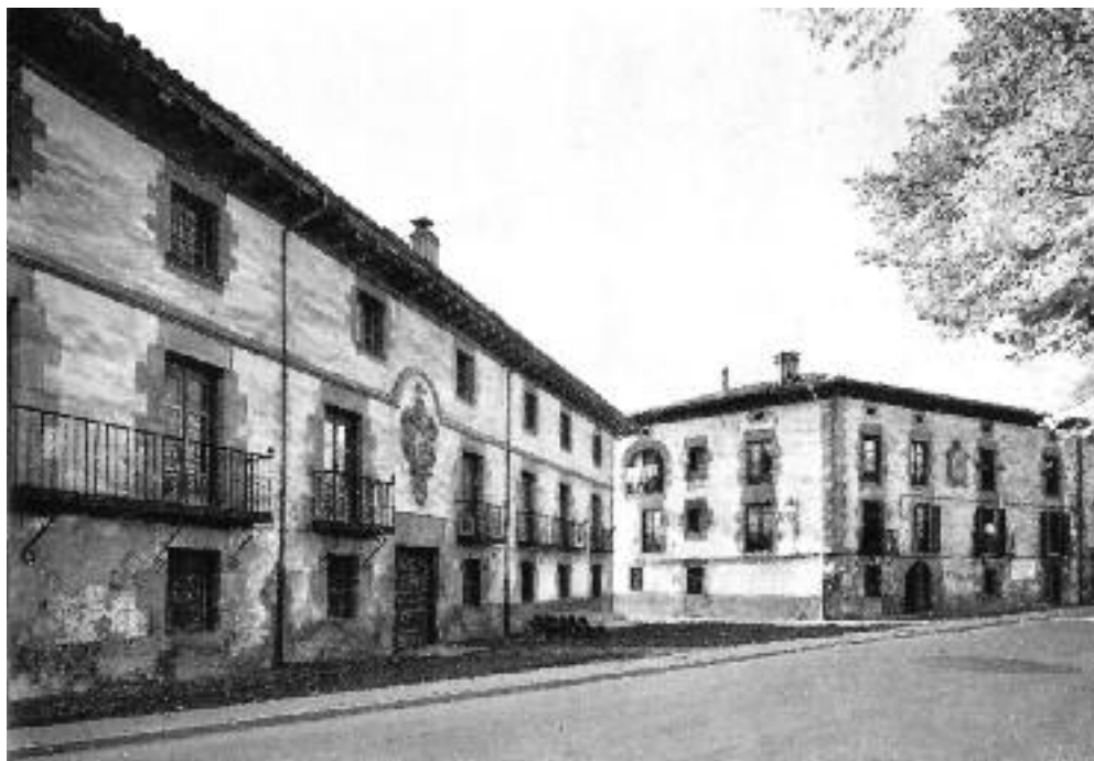
Antixena eta Madinabeitia jauregiak 1980 aldera.

XX. gizaldian bilakaera gorabeheratsua izan zuen: lehenengo urteetan Nevers-ko moja frantsesek okupatu zuten etxearen zati