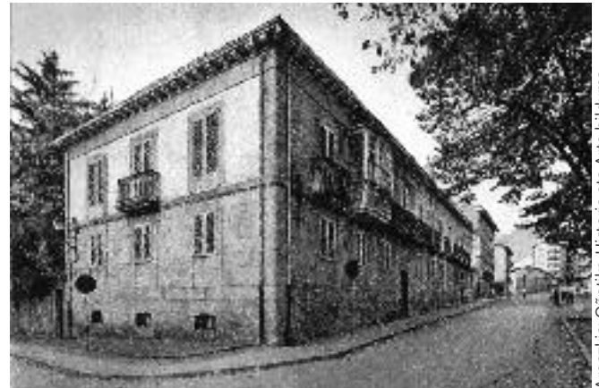
Moiua etxea 1980 aldera.