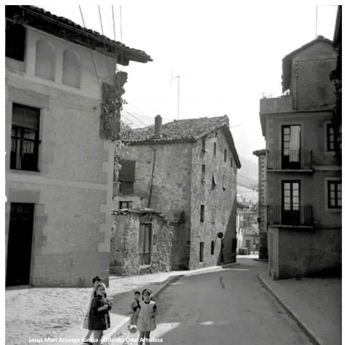
Patruie kalea 1960ko hamarkadan.