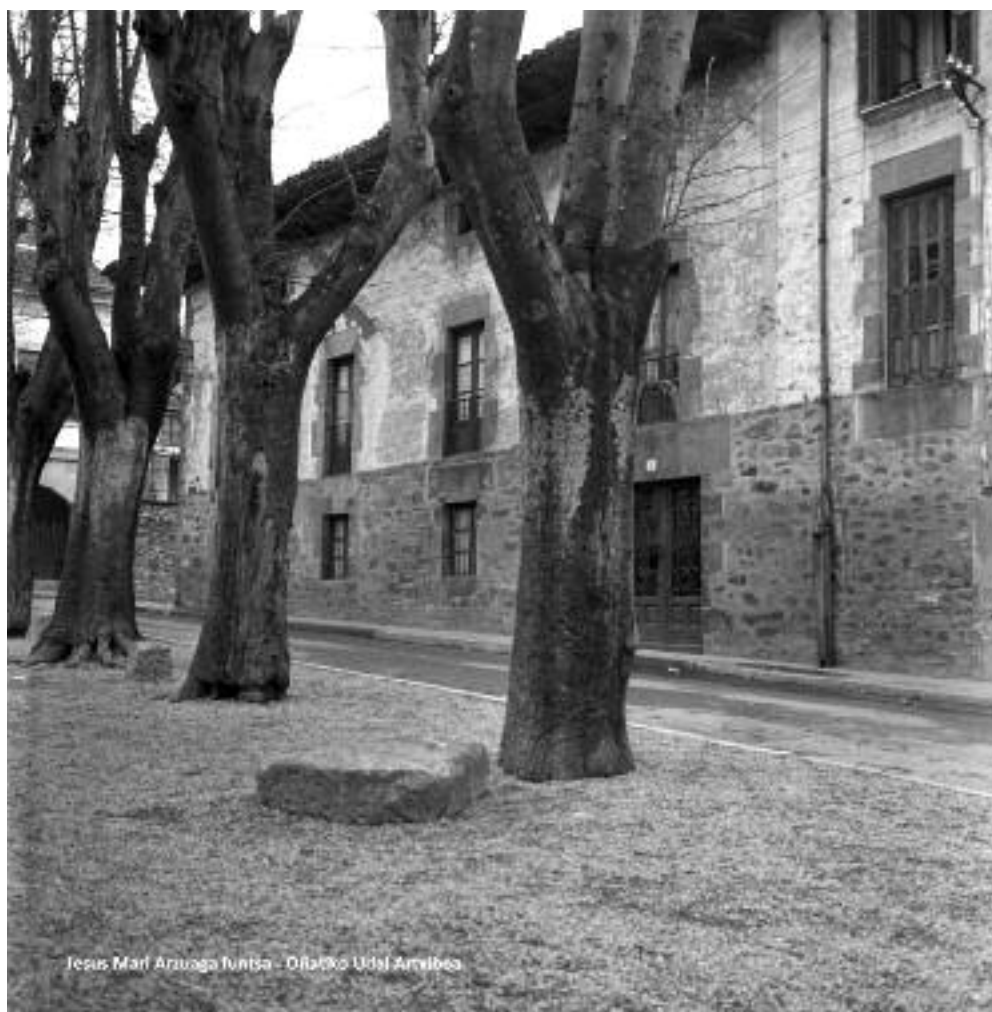
Santa Marinako Baruekoa etxea ezkerreko aldea aldatu aurretik.

Ermitako kanpaia eta San Markosen erretaula orduantxe eraikitzen ari ziren Urrutxu aldeko hilerri berriko kaperara eraman zituzten . Kanpaiak han jarraitzen du, baina erretaula duela urte batzuetako erreforman kendu zuten.