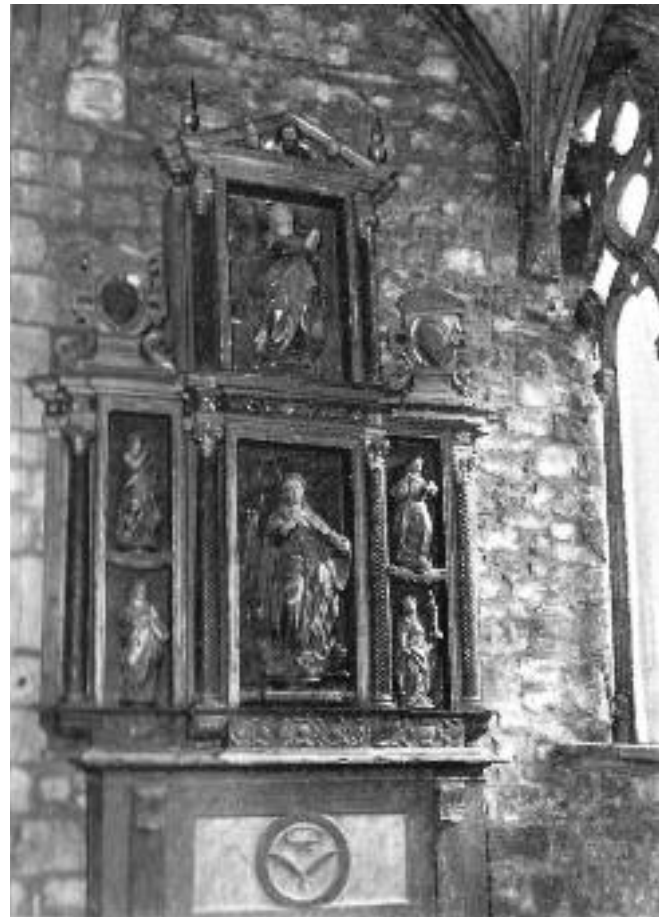
Oñatiko Historia eta Arte bilduma