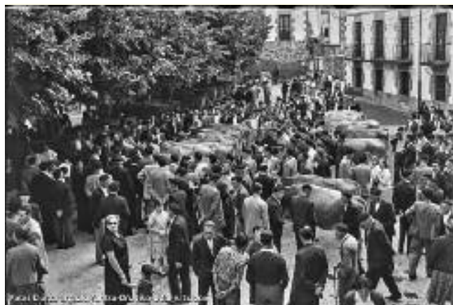
Santa Marina feria-egun batean.