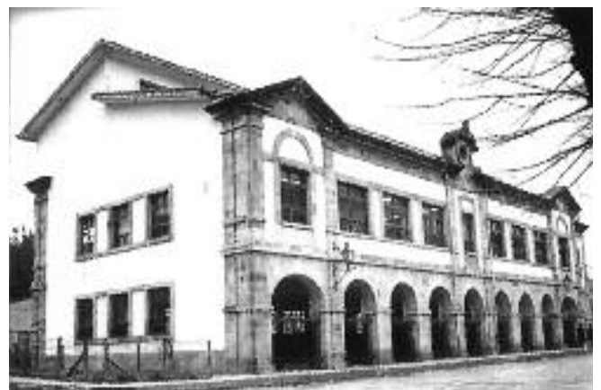
Milagrosa ikastetxea 1969an.