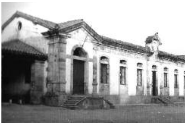
Santa Marinako herri-eskola 1966 aurretik.

Zenbait hilabete batere eskola barik egon ondoren eta behin behineko maisu batzuekin aritu eta gero, mutikoen arazoari nolabaiteko konponbidea emateko, gerra amaitzean, maristak ekarri zituzten berriro unibertsitate zaharrera , handik institutua ere kendu egin baitzuten 1936an. Horrenbestez, Santa Marinako eskola publikoa oso ikasle gutxirekin geratu zen