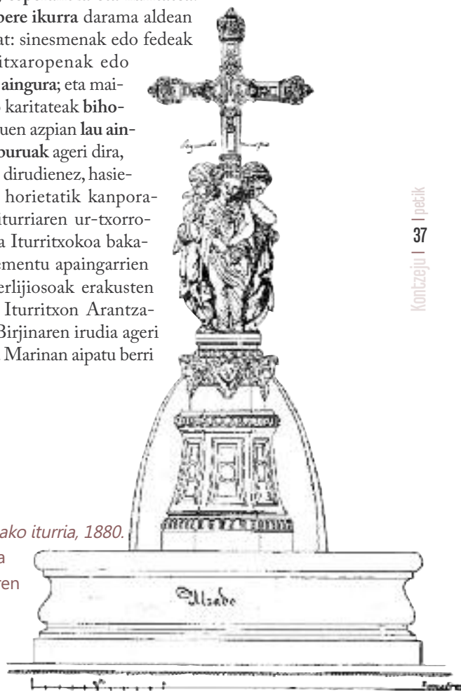
Santa Marinako iturria, 1880.

Gurutzea hiru emakumeren imajinek inguratzen dute, bertute teologalak irudikatzen dituztenak, hots, fedea, esperantza eta karitatea . Bakoitzak bere ikurra darama aldean ezaugarritzat: sinesmenak edo fedea gurutzea ; itxaropenak edo esperantzak aingura ; eta maitasunak edo karitateak bihotza . Irudi hauen azpian lau aingerutxoren buruak ageri dira, aho zabalik; dirudienez, hasieran ahotxo horietatik kanporatzen ziren iturriaren ur-txorrotak. Hau eta Iturritxokoa bakarrik dira elementu apaingarrien artean gai erlijiosoak erakusten dituztenak: Iturritxon Arantzazuko Ama Birjinaren irudia ageri da eta Santa Marinan aipatu berri ditugunak.