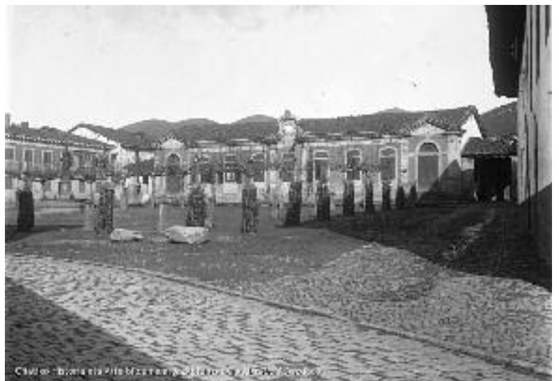
Eskuman idi-dematarako probalekua Santa Marinako plazan.

Ostiraletako ohiko feriaz gain, beste abere-azoka berezi batzuk ere burutzen ziren urtean zehar. Esaterako, apirilean, San Jurgi egunez, ganadu-erakusketa bat antolatzen zen, sari eta guz-