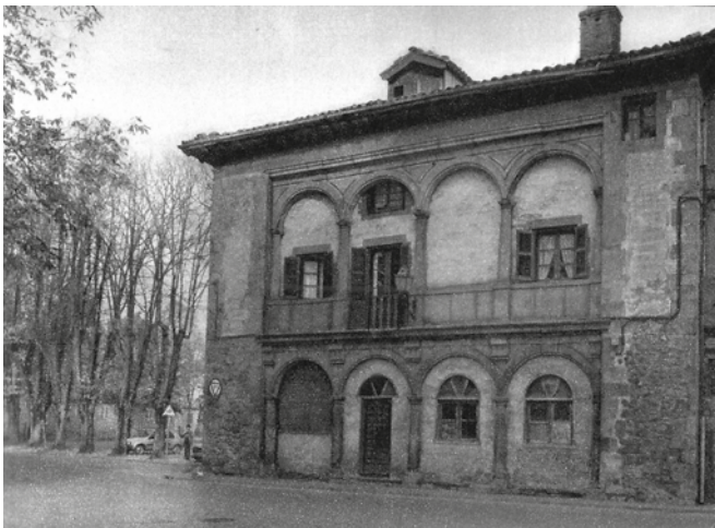
Arotzen tailerrak egondako lekua Baruekuan.