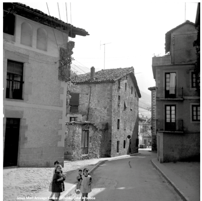
Patrue kalea 1960ko hamarkadan.