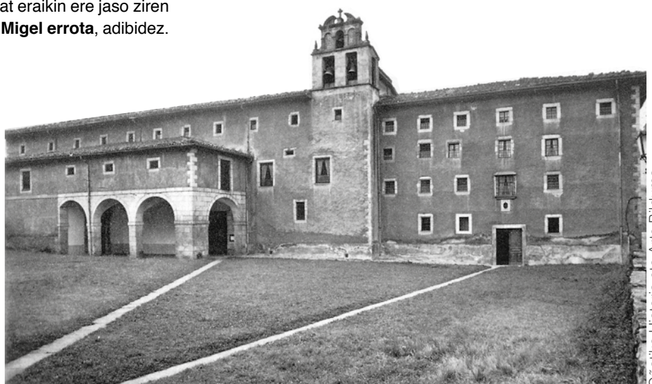
Santa Anako komentua 1980 inguruan.

la etengabe egon ziren belaunaldi anitzetako mojak Santa Anan. Salbuespen bakar eta laburra 1794-1795 bitartean jazo zen. Frantziako Iraultzaren hasieran, konbentzio-gerra zela eta, tropa frantsesak Hego Euskal Herrian sartzean, komentuetako mojek leku seguruagora ihes egin zuten. Santa Anakoek hasieran Arabako Barriara jo zuten eta geroago Errioxako Brionesera . Baina Basileako bakea sinatutakoan, berehala itzuli ziren Oñatira. XIX. eta XX. gizaldietako gatazka eta gerretan ez ziren herritik atera, eta halakoetan inguruko beste komentu batzuetako emakume erlijiosoek topatu zuten babesa eta aterpea Santa Anan.