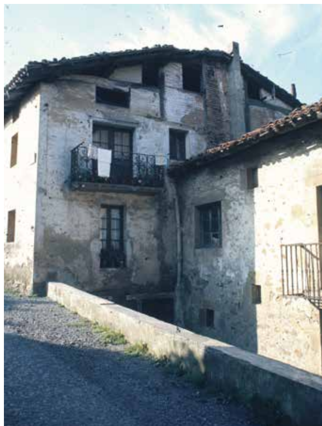
Oñatiko Historia eta Arte Bilduma

Alabaina, gerora leku hobea bilatzeari ekin zioten. Hartarako, 1885ean, San Juan kalean etxe bat egokitzea pentsatu zen . Kalearen akaberan zegoen, eskuma aldetik. Gaitzak jotako