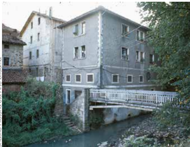
Oñatiko Historia eta Arte bilduma

San Juan kaletarrek betidanik aldarrikatu dute Kolegialdera , unibertsitate ingurura, hurreratzeko pasabidea , erreka gaine-